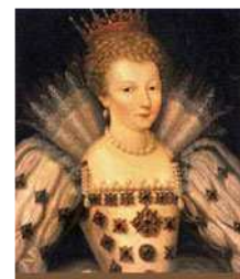
Mary Stuart La mia Regina Preferita