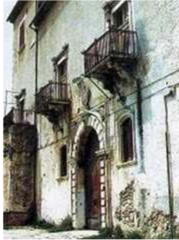
Palazzo Ducale Gaetani