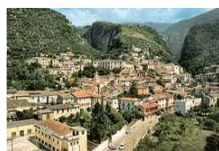
Panorama di Piedimonte Matese

La Voce libera dell'informazione di Terra di Lavoro