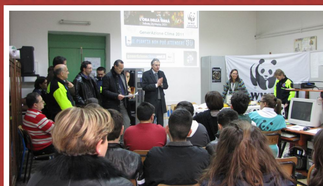
SMS "BOSCO" - MARCIANISE