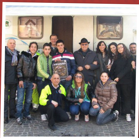
SMS "DI FILIPPO" SAN NICOLA LA STRADA

Earth Hour del WWF Caserta è stato patrocinato da :