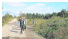
Resoconto Attività 2017 delle Guardie Volontarie WWF a Napoli, Caserta e Salerno

VASTA OPERAZIONE DI VIGILANZA VENATORIA CONGIUNTA TRA CORPO FORESTALE DELLO STATO, WWF ED EMPA IN PROVINCIA DI NAPOLI. A GIUGLIANO IN CAMPANIA: DUE