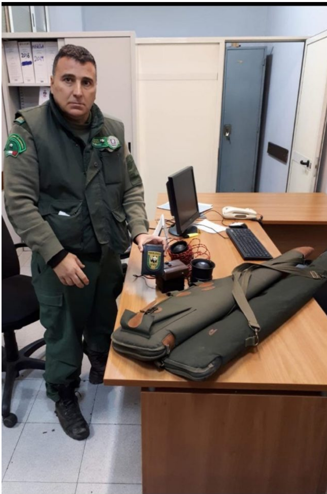
Armi e richiami sequestrati ai bracconieri