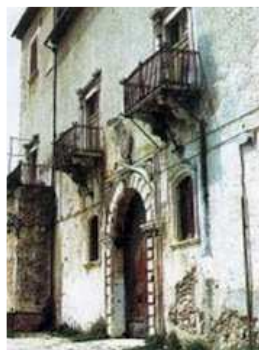
Palazzo Ducale Gaetani