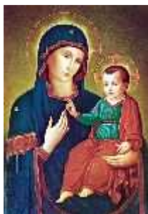
Madonna della Consolata di Torino